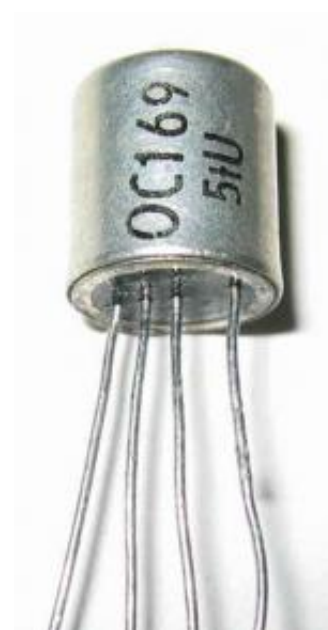
OC169: Sammlung Wolfgang Bauer